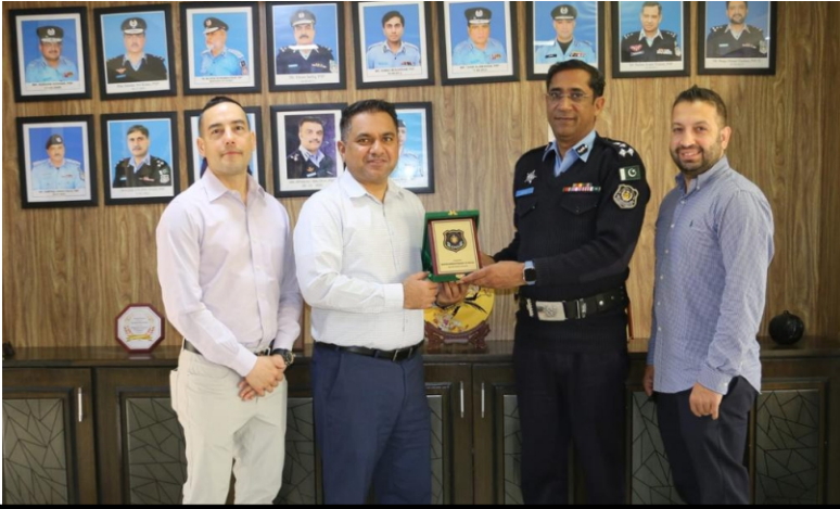
نیویارک پولیس ڈیپارٹمنٹ کی کرکٹ ٹیم کے وفد نے سی پی او سکیورٹی آفس کا دورہ کیا