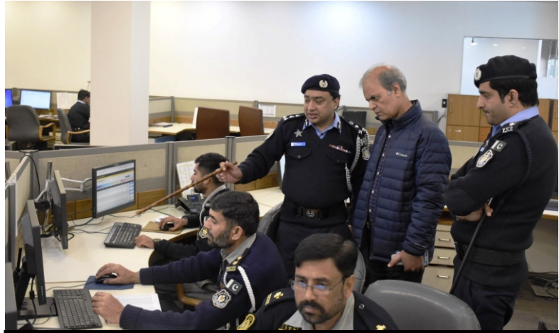
آئی جی گلگت بلتستان پولیس کاسیف سٹی اسلام آباد کا دورہ