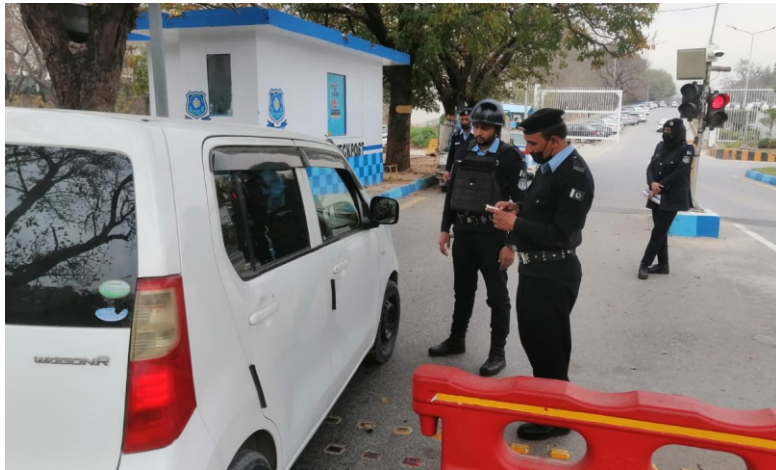
Islamabad Capital Police ensures foolproof security arrangements in diplomatic enclave