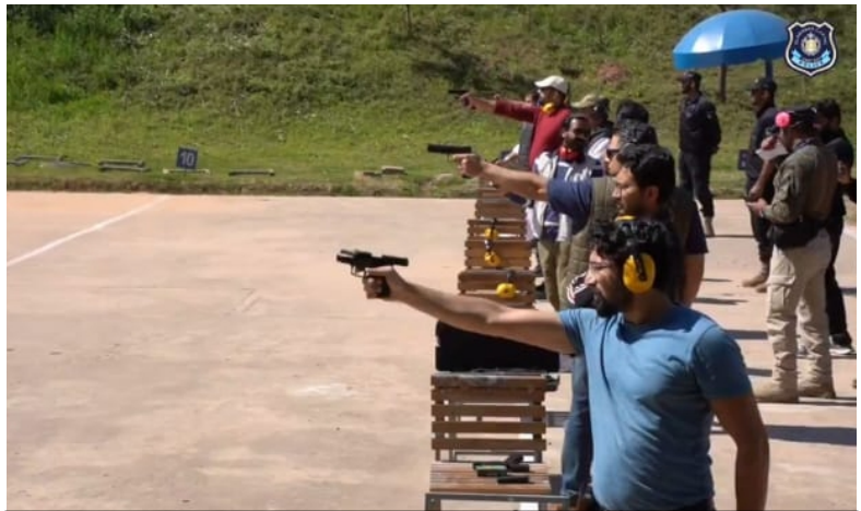
ICP has established a "Firing Practice Club" for law enforcement agencies, security guards and common citizens