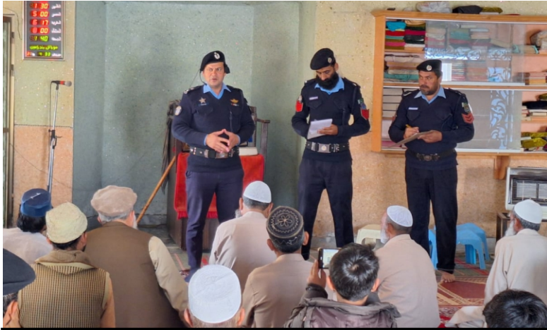
ڈی پی او انڈسٹریل ایریا زون کی تھانوں کے علاقہ سیکٹر 16-1 مسجد صدیق اکبر میں کھلی پھری کا انعقاد