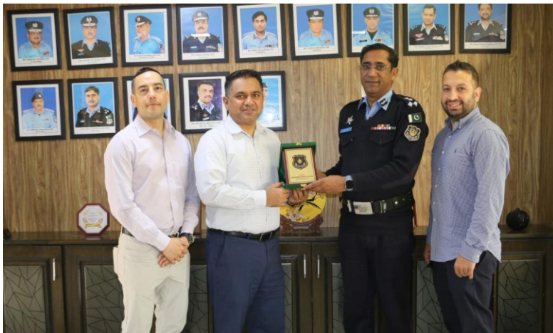
NYPD cricket team visits Security Division