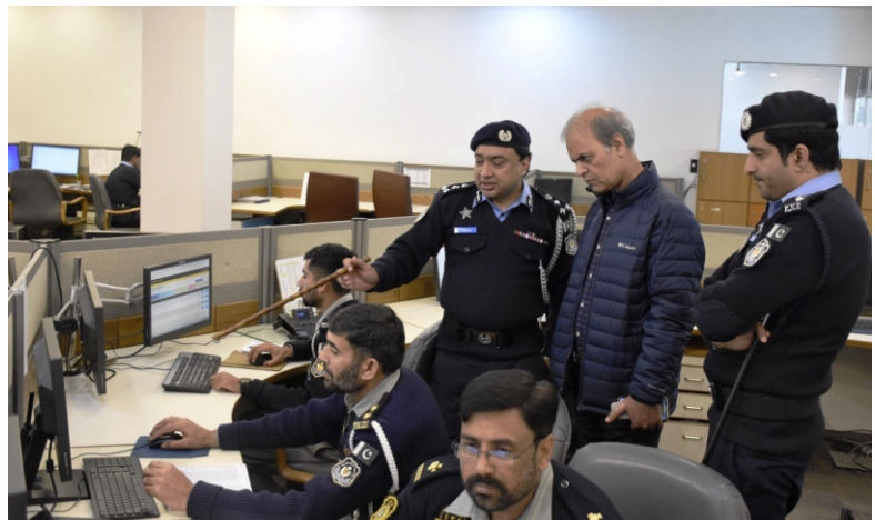
Inspector General of Police (IGP) Gilgit Baltistan visited Safe City Islamabad