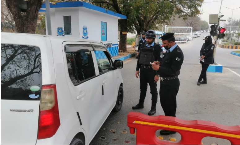
شہر کے داخلی و خارجی راستوں اور ہائی سکیورٹی زون کے مختلف ناک جات پر پڑتال کا عمل جاری رکھے ہوئے ہیں