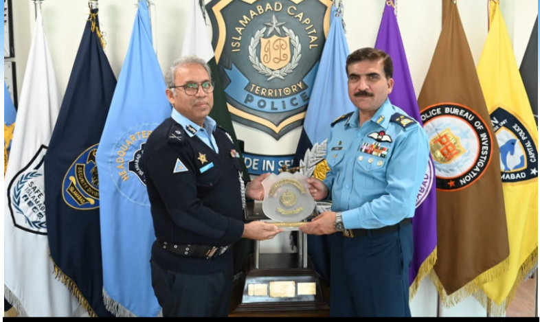
ڈی جی سکیورٹی پاکستان ایئر فورس ایئر وائس مارشل فاروق آفریدی نے آئی سی پی او سے سینئر پولیس آفس میں ملاقات کی