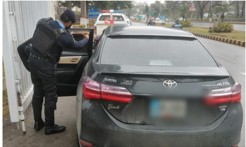
اسلام آباد کنستبل پولیس نے ضلع بھر میں کالے شیشے والی گاڑیوں کے خلاف کریک ڈاؤن مزید تیز کر دیا ہے